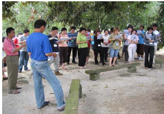
上图:候洗者在户外进行拜苦路的经历和体验。

(雪兰莪)加影圣家堂华文组成人慕道班于2006年4月1日及2日假THE FARM举办慕道候洗者避静营。避静营的主题定为“在基督内死而复活”,并邀请赵通强修士成为此营的讲员。