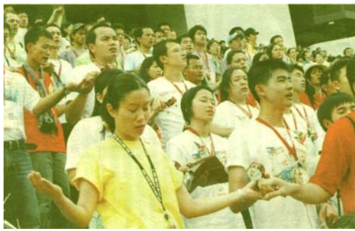
亚青节开幕礼上各地青年一起祈祷

此项由亚洲主教团协会“教友及家庭委员会”青年办公室主办, 香港教区协办的活动, 包括: 工作坊、体验活动、展览、宗教交谈和文艺表演, 目的为协助青年们反思当前及理想的家庭状况。